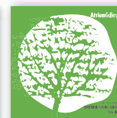
施設案内リーフレット、ギャラリー企画展示のグラフィックデザイン